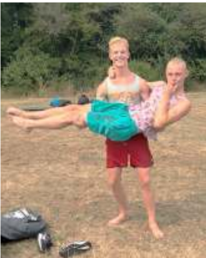
De ontdooide shirts

Gedurende de week zijn er verschillende regeerperiodes geweest. Sommige heersers waren gul en vergevingsgezind. Anderen waren streng maar rechtvaardig. De strijd om het koningsschap was hard. De nar was in ieder geval altijd de sjaak voor nare klusjes.